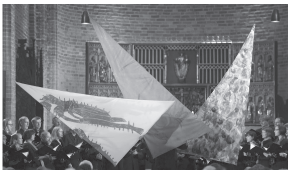
Gründungsgottesdienst im Ratzeburger Dom

Gottes Geist war als lebendige Kraft zu spüren über die Mauer hinweg, als die