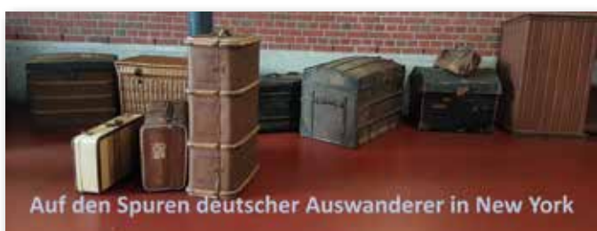
Auf den Spuren deutscher Auswanderer in New York